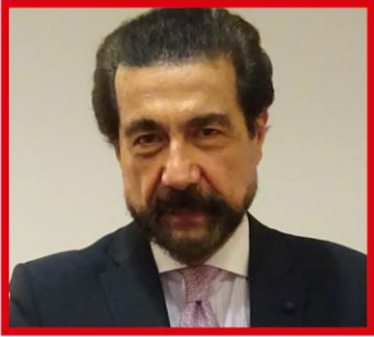
Δρ Αντωνιάδης Στέλιος

Παιδοκαρδιολόγος – Παιδίατρος Καθηγητής Πανεπ/μίου Διευθυντής, Συγγραφέας, Ιδρυτής - Πρόεδρος ΕΛ.ΕΠ.Ε.Π.Α.